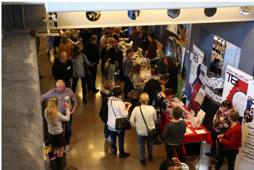
Utställningsbesökare på rikskonferensen Tekniken i skolan 2015

Det finns plats för fler! Boka på www.cetis.se