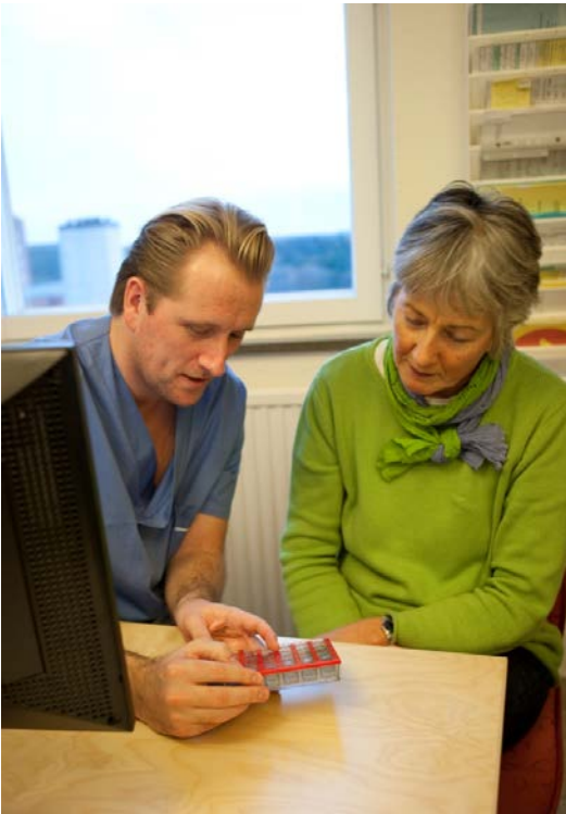
Patienter som medarbetare