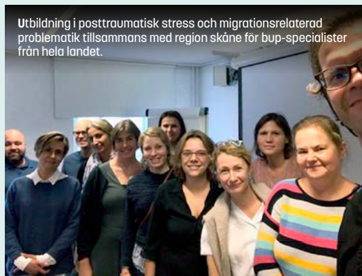
Utbildning i posttraumatisk stress och migrationsrelaterad problematik tillsammans med region skåne för BUP-specialister från hela landet.

(PTSD) hos barn, varav en i samarbete med modellregion Skåne.