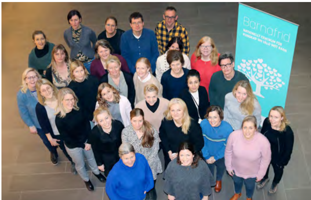
Glada deltagare i uppdragsutbildningen TF-KBT, 7,5hp.