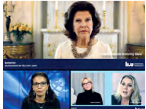
Vid den digitala lanseringen av basprogram om våld mot barn medverkade bland andra Hennes Majestät Drottning Silvia, Socialminister Lena Hallengren och FN:s särskilda sändebud i frågor om våld mot barn, Dr Najat Maalla M'jid.