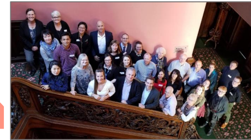
International Consortium on Dementia and Wayfinding (ICDW) Webinars 2020 visade digitala möjligheten