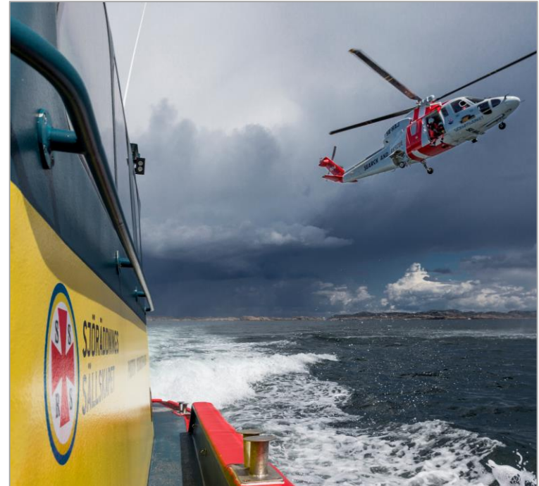
Sjöfartsverkets och Svenska Sjöräddningssällskapets räddningsenheter