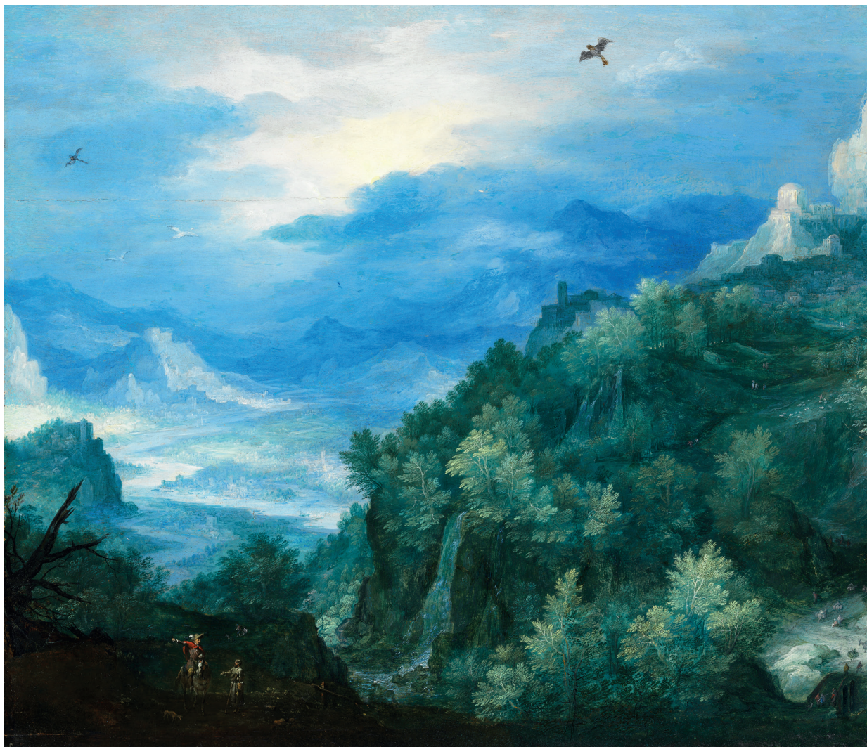
Jan Brueghel den äldre, Berglandskapet , ca. 1600.