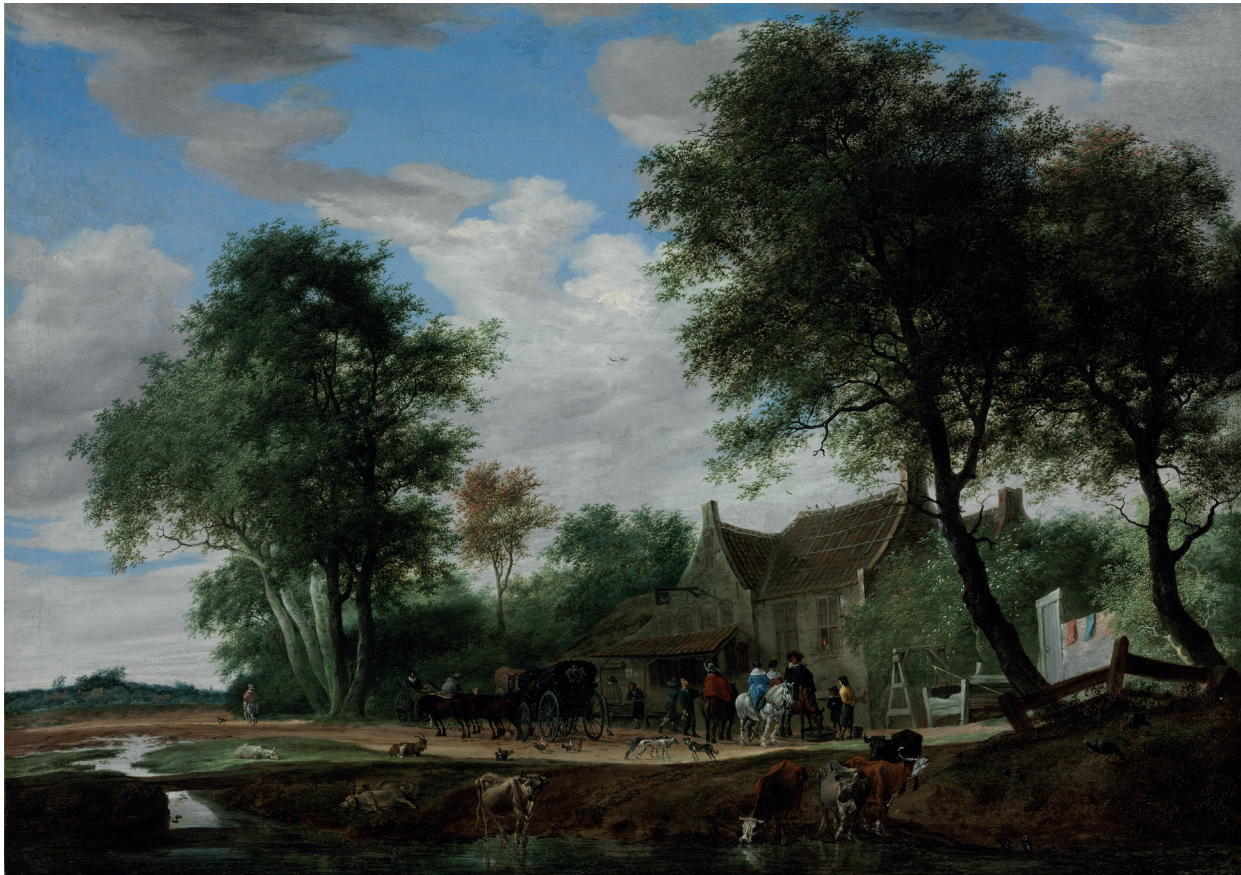
Salomon van Ruysdael, Resande vid värdshuset Den Vita Svanen , 1662.