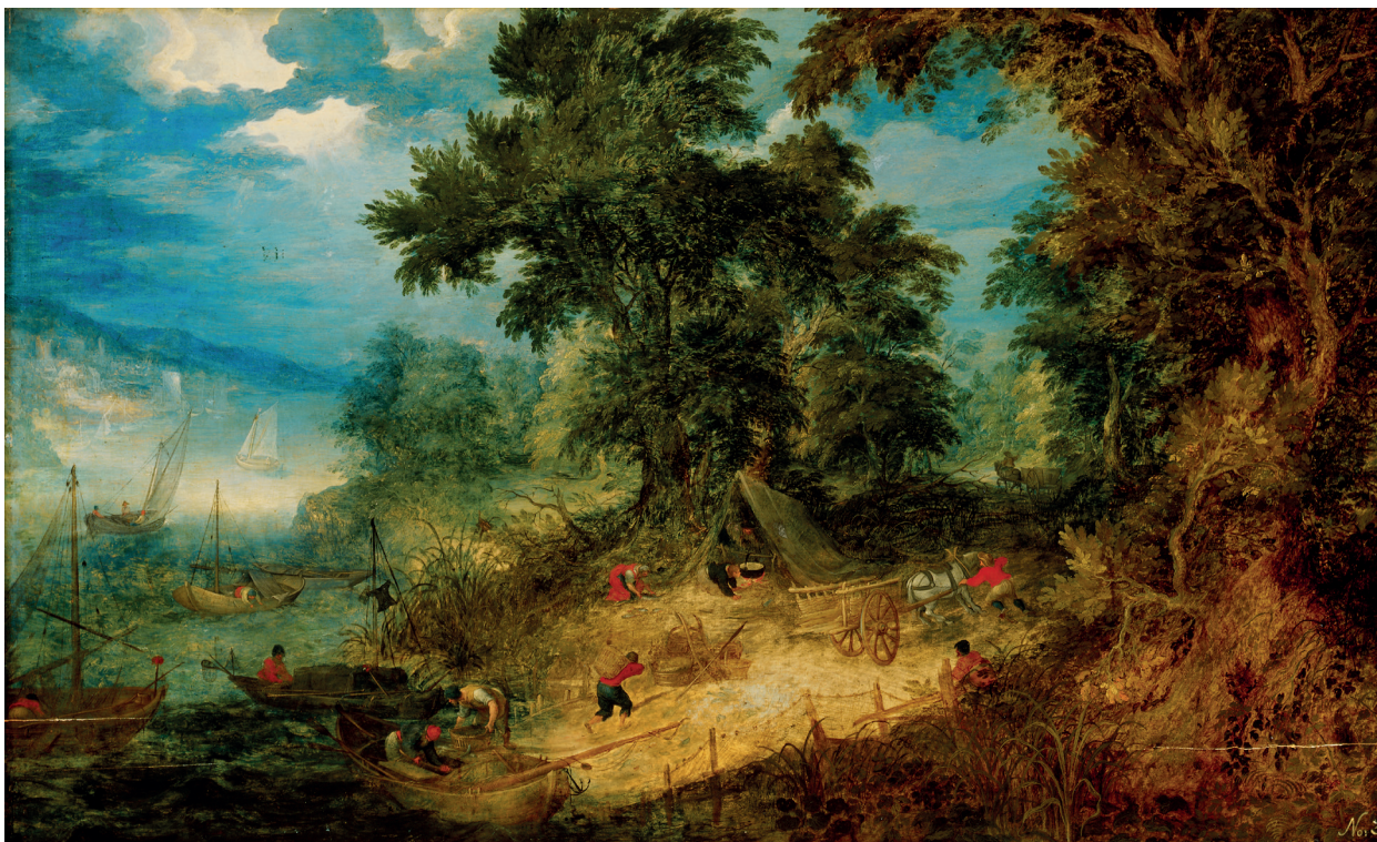
Abraham Govaerts, Landskap med fiskare , 17-talets första kvartal.