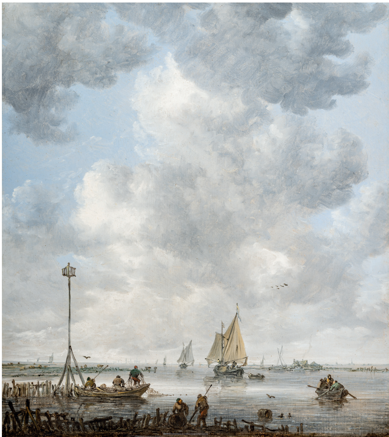
Jan van Goyen, Sjölandskap med fiskare , ca. 1646–1650.

Alla konstverk från Museum of Fine Arts samlingarna har reproducerats med museets tillstånd.