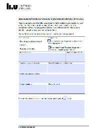
dok: Skrivbar pdf-TP abroad four weeks - assessment form