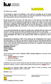
dok: 2019-20 en mall hl-brev m fakturainfo