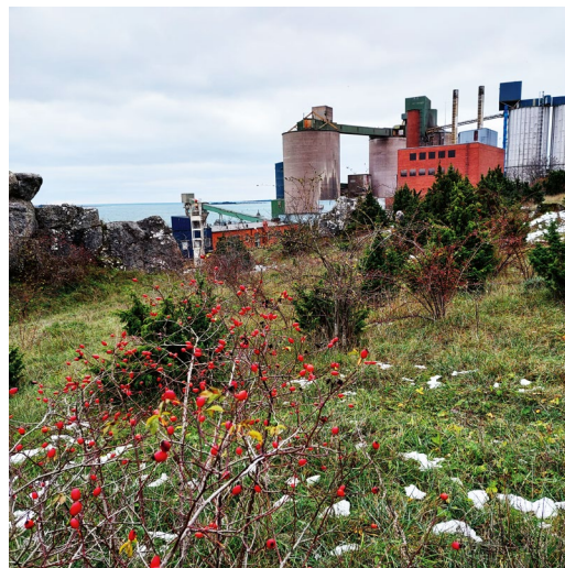
Cementas fabrik i Slite.

På senare år har dessa tre industriorter hamnat i centrum för den klimatpolitiska debatten. För att det ska vara möjligt att nå Sveriges nationella klimatmål måste industriutsläppen minska snabbt och alla tre fallstudieorter står därför inför stora förändringar. I Luleå satsar SSAB stort för att ersätta den utsläppsintensiva järnmalmsreduktionsprocessen med vätgas och skapa en fossilfri värdekedja från gruva till slutprodukt. I Lysekil siktar Preemraff mot klimatneutralitet genom att rikta om sin verksamhet från olja till biobränslen. I Slite planerar Cementa att använda mer biobränslen i produktionen och bygga en anläggning som kan fånga in fabriken koldioxidutsläpp. Parallellt med denna industriella nyorientering har klimatrörelsen tagit strid mot den svenska stål-, olje- och cementindustrin. Under de senaste åren har det genomförts ett flertal protestaktioner mot industriverksamheterna i Lysekil, Slite och de norrländska malmfälten. Klimatprotesterna rört upp känslor och ställt den nationella klimatpolitiken mot lokal utveckling och sysselsättning.