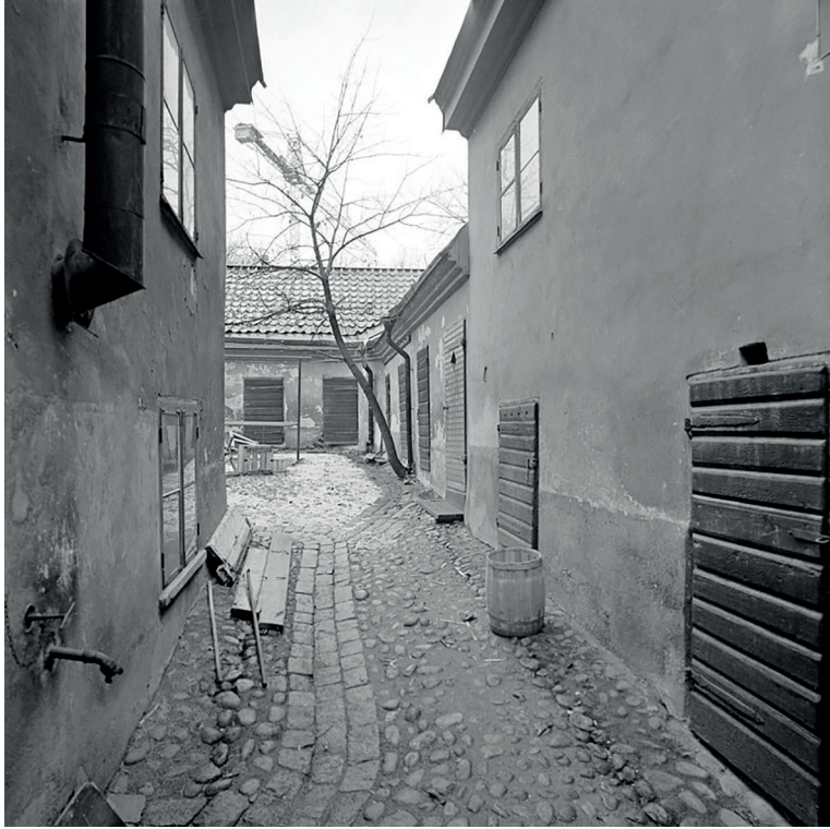
11. Vatten och avlopp