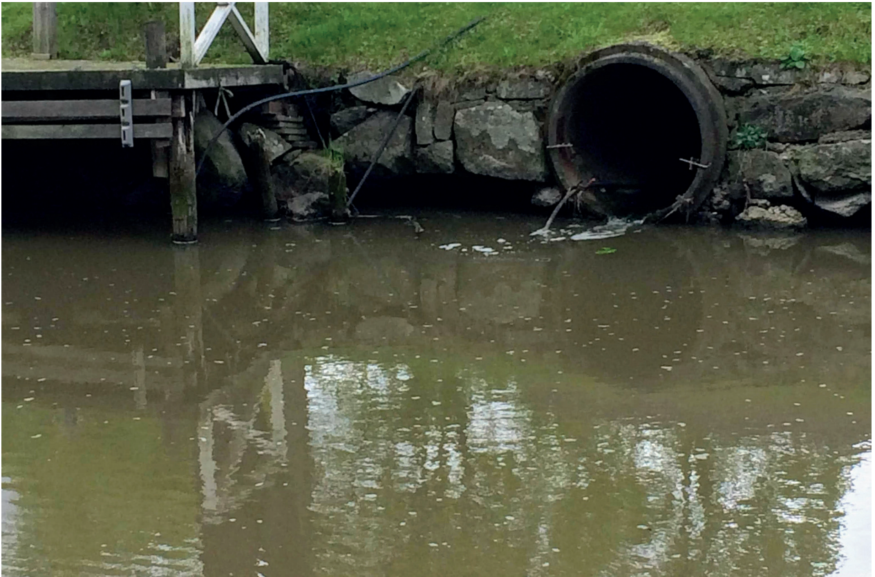
15. Vatten och avlopp