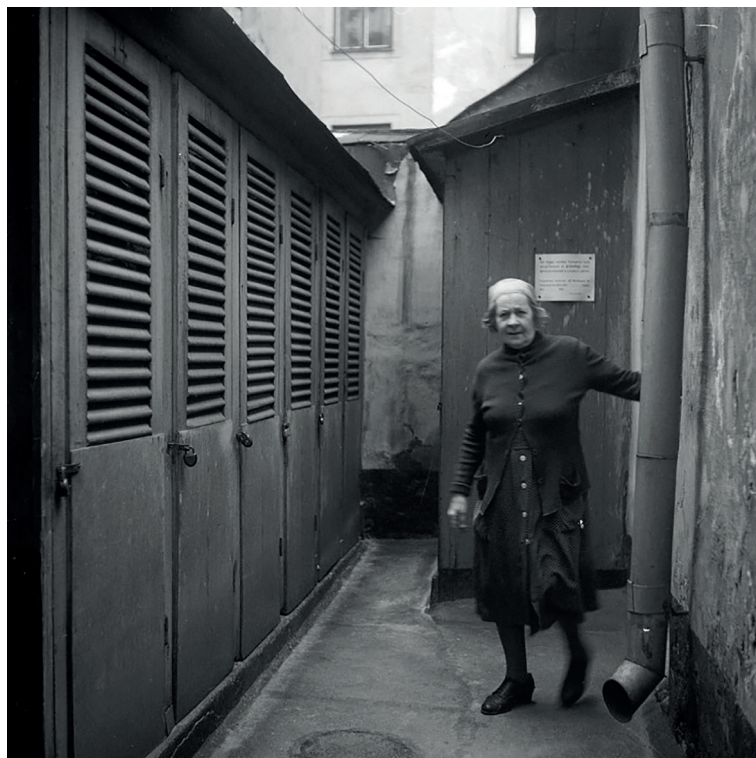
8. Vatten och avlopp