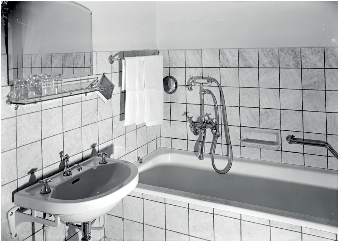
7. Vatten och avlopp