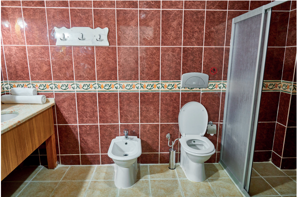
3. Vatten och avlopp