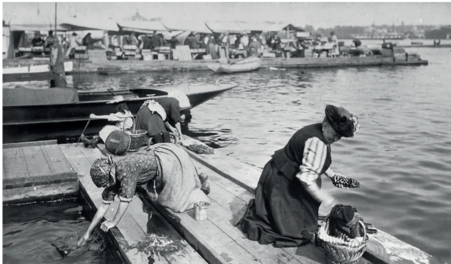
13. Vatten och avlopp