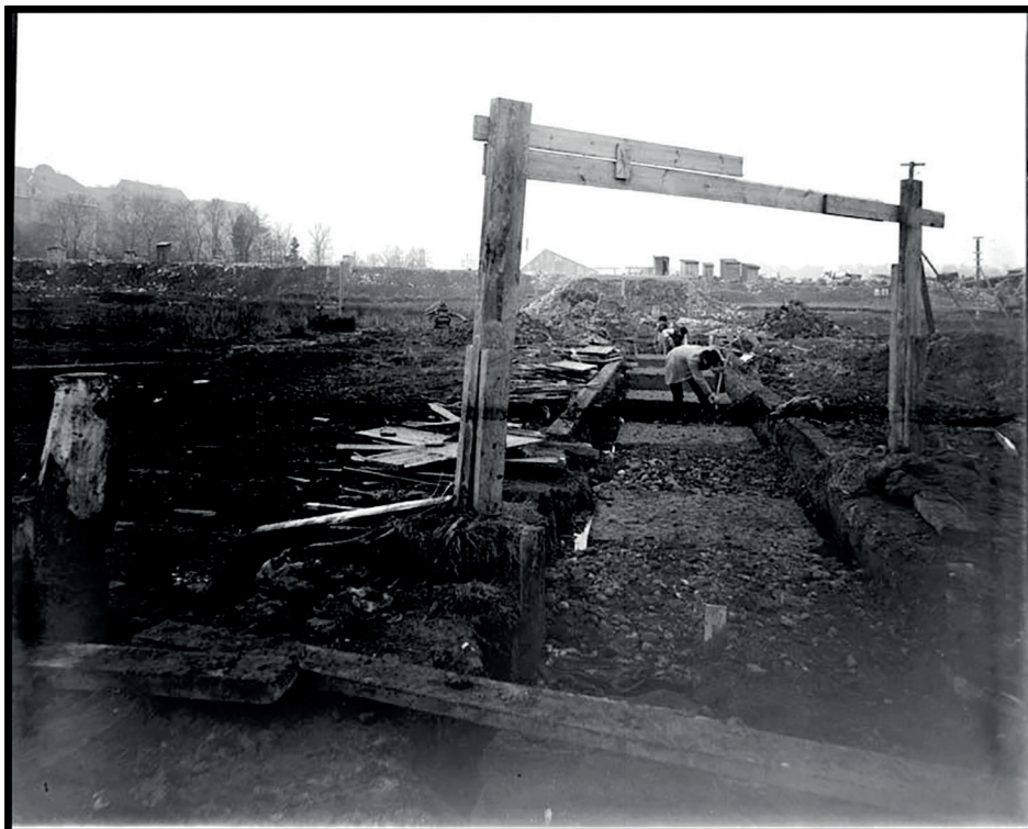
20. Vatten och avlopp