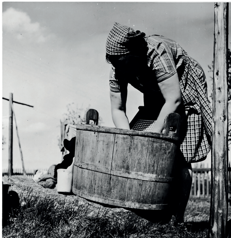
16. Vatten och avlopp