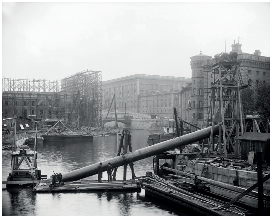
14. Vatten och avlopp