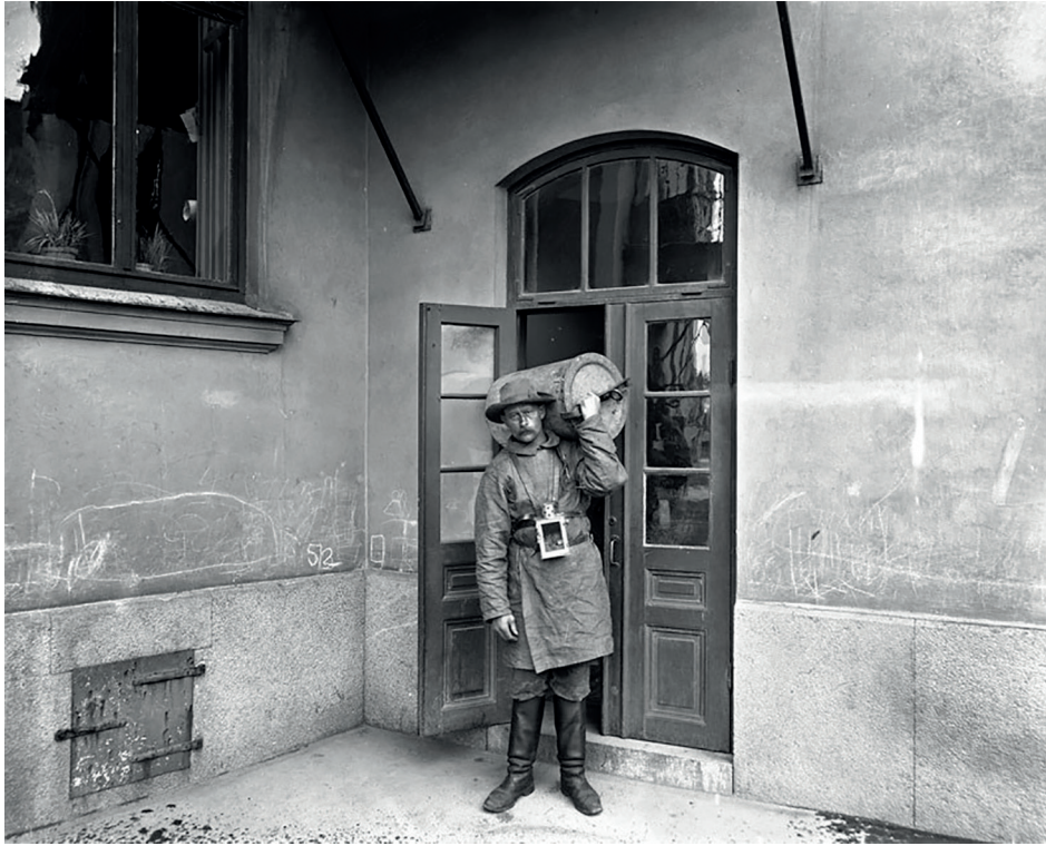
17. Vatten och avlopp