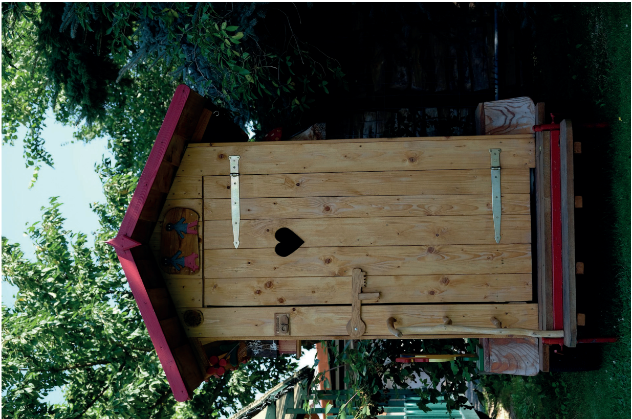
2. Vatten och avlopp