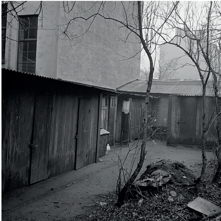
9. Vatten och avlopp