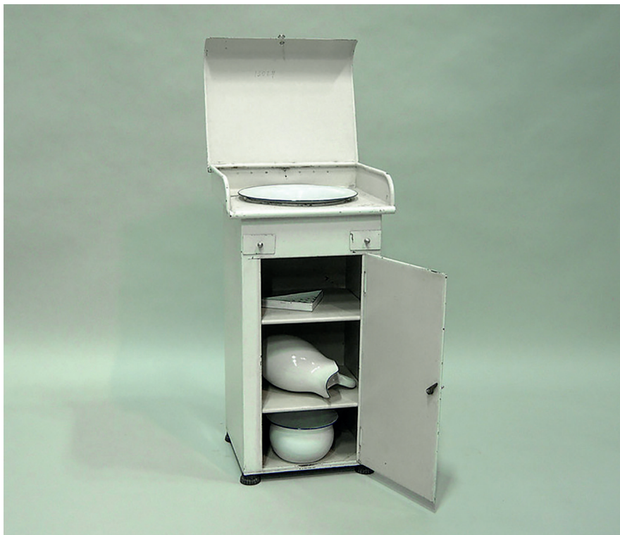
6. Vatten och avlopp