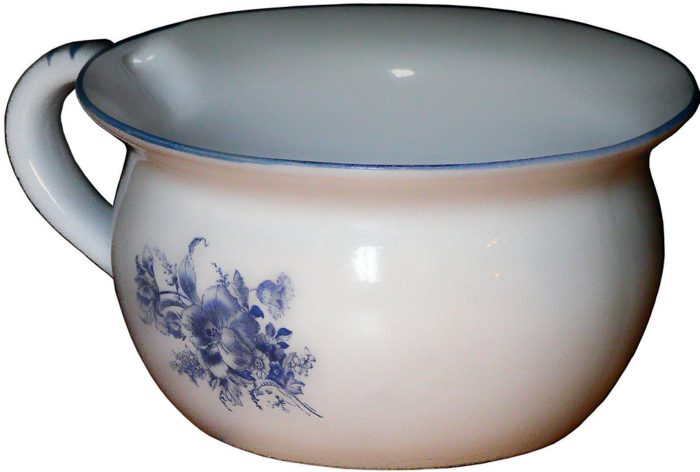
1. Vatten och avlopp

Bilder till Stad i förändring, Teknik Tillsammans