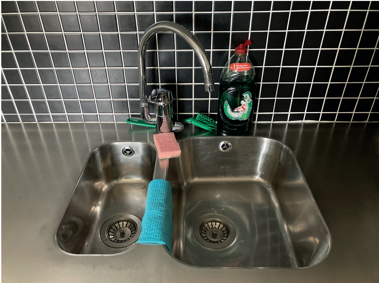
19. Vatten och avlopp