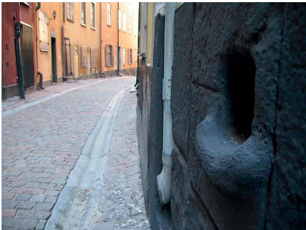
10. Vatten och avlopp