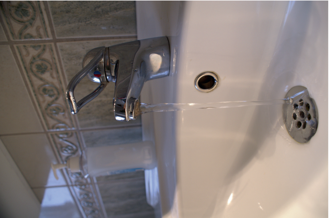
5. Vatten och avlopp