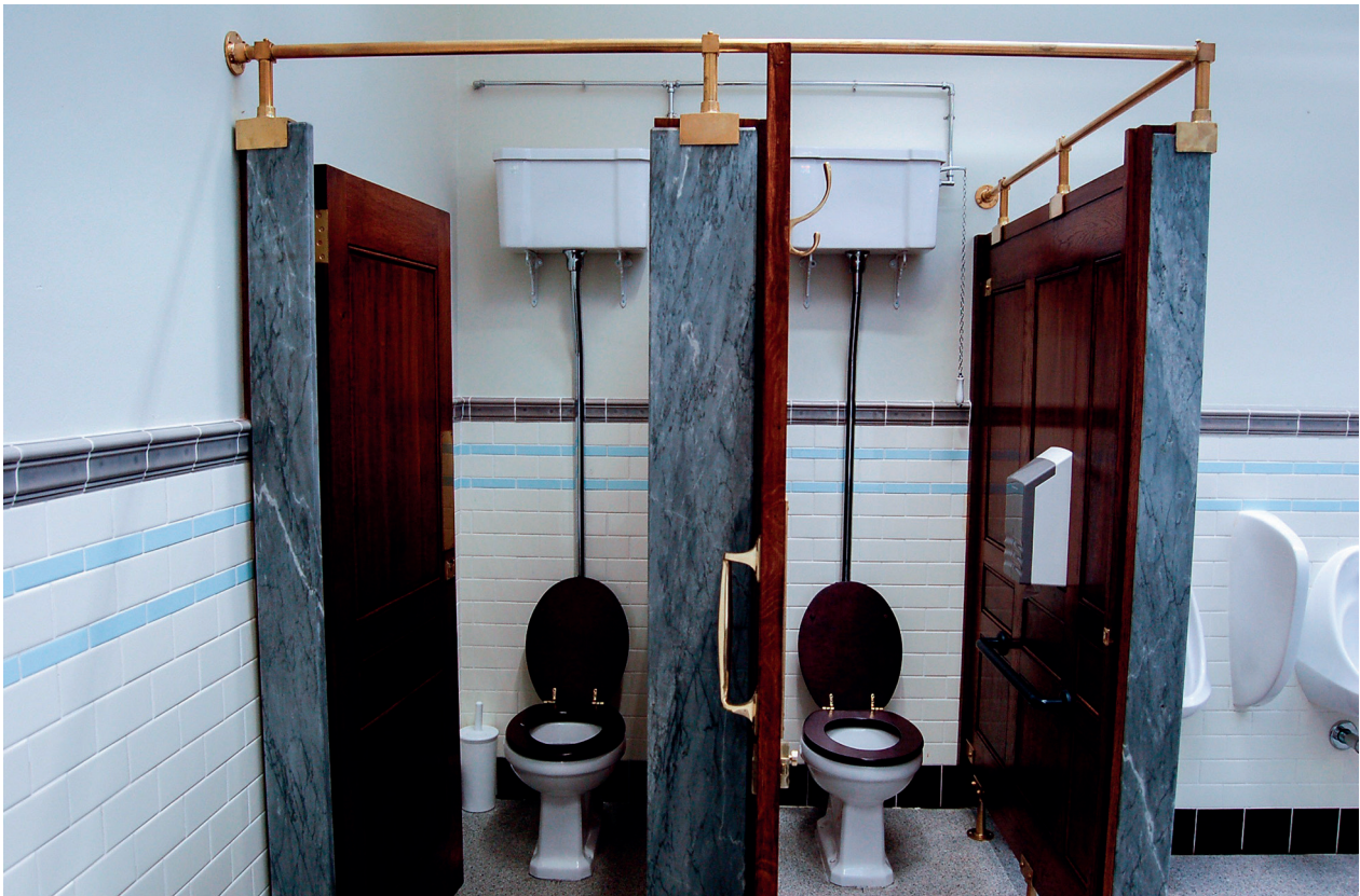
18. Vatten och avlopp