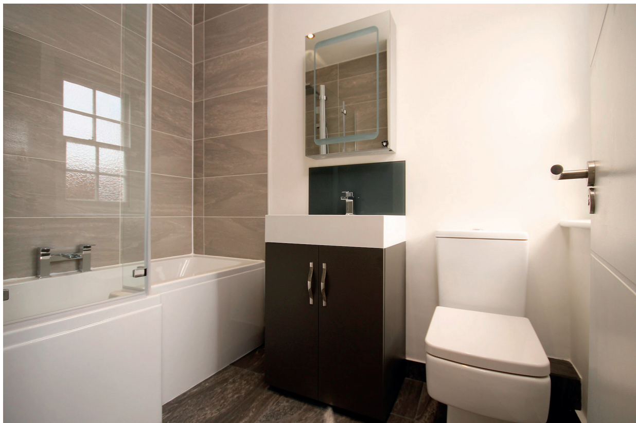
4. Vatten och avlopp